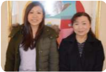
お母さんとのツーショット (翠光園看護職員)