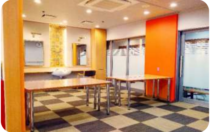
リラクゼーション室・美容室