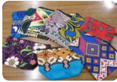
現地の布を使った作品

アフリカのマラウイで活動する5S協力隊員がお話ししました。日本と現地の違いに戸惑いながらも、派遣先の発展の為に頑張っています。