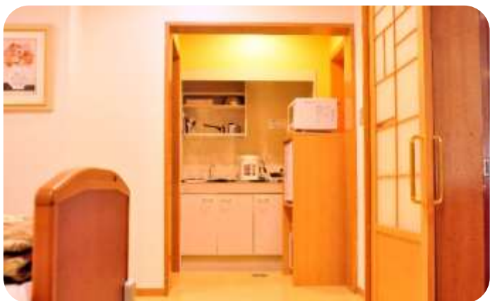
看取り室キッチン・トイレ